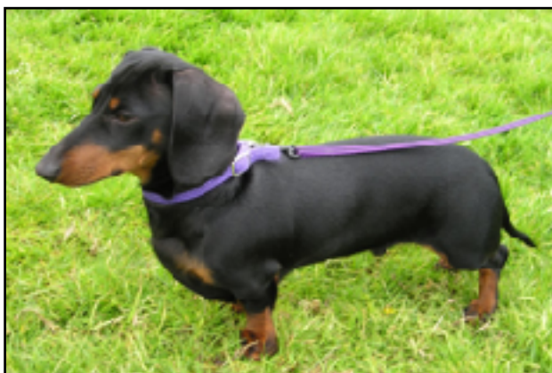
Promenadlimpa, även kallad tax

Ur Världens dåligaste språk: Pratet om att svenskan är fattig avfärdar Fredrik Lindström så här: