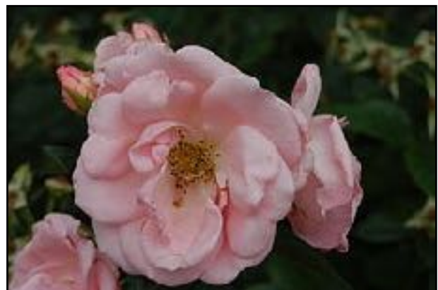
Strauchrose "Pippi Långstrump" (Poulsen 1989)