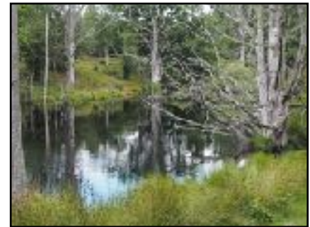
Naturschutzgebiet Am Ronneby im Korrö

Wer den Weg der Auswanderer direkt von ihrem Heimatort bis zum Hafen in Karlshamn verfolgen will, kann dafür einen Rad- und Kulturweg wählen. Dieser Weg beginnt in Eriksmåla und führt über Skruv und die Kreuzung in Åkerby weiter nach Långasjö und Eringsboda, über Backaryd,