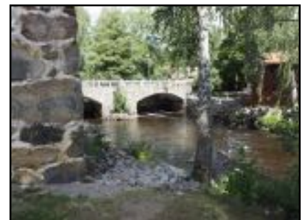
Text und Fotos: Gertraud Geyer

Hoby und Åryd nach Karlshamn. An vielen Stellen sind historisch interessante Orte zu besuchen, oder man kann die Schauplätze aus Mobergs Romanen wiederfinden. Radeln oder paddeln ist auch schön, aber wir fanden, dass das ruhige und gemächliche Wandern in der Stille des Waldes am schönsten ist. Ein Paradies zum „Waldbaden“.