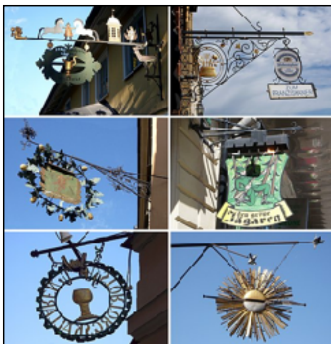
Krogskyltar i Stockholm: Stallis (Stallmästaregården), Zum Franziskaner, Den Gyllene Freden, Den gröne Jägaren, Stortorgskällaren, Aurora

Holger Ellgaard är en av Wikipedias flitigaste medarbetare. Hans artikel om Stockholms historiska värdshus röstades nyligen fram till månadens bästa artikel.