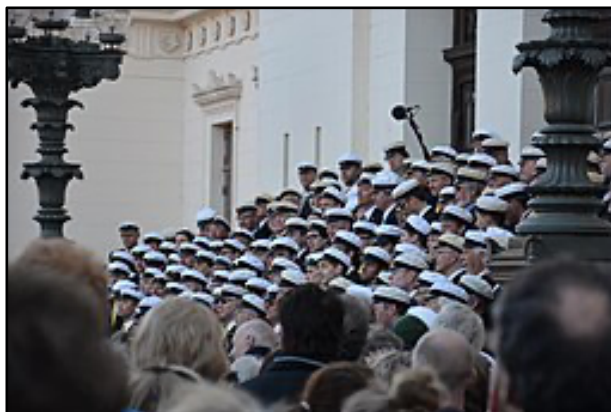
Lunds studentsångförening, Foto Bengt Oberger, Wiki

Redan på medeltiden brukade djäknarna (skolpojkar) anordna upptåg på valborgsmässoafton, och fortfarande anordnas studentspex och liknande denna dag.