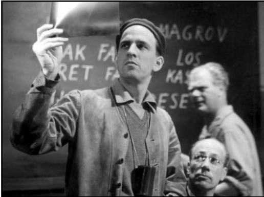
Ingmar Bergman, 1957

13.4., 19:30 Uhr (Gärtnerpl.th., M.): Das Lächeln einer Sommernacht (Musical nach Ingmar Bergman)