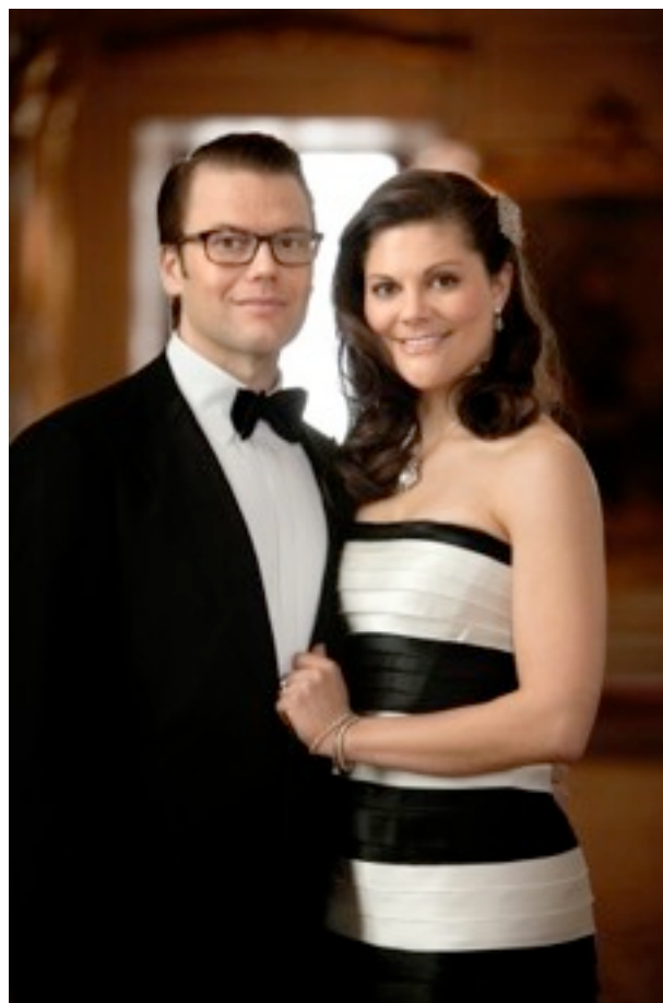
Från hovstaternas hemsida: Kronprinsessparet Fotograf: Paul Hansen

Mer information och foton på: http://www.royalcourt.se