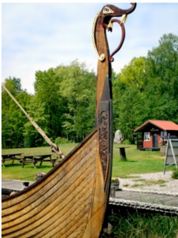
(Vikingskeppet Sigrid Storråda hemma i Blombergs hamn, Kinnekulle)

HUR kan jag ha missat att läsa Röde Orm tidigare? Det är en av de roligaste och lärorikaste och språkligt intressantaste böcker, som jag någonsin fått tag i. Den valdes fö till 1900-talets tredje mest betydelsefulla roman (efter Mobergs Utvandrarsvit och Martinssons Aniara ) av litteraturprogrammet Röda